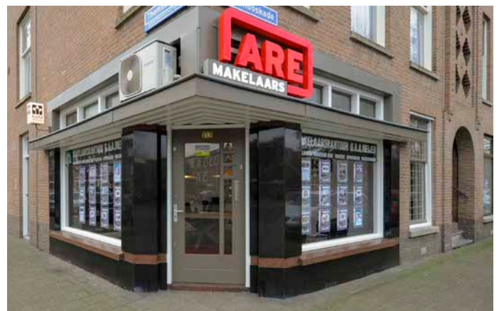
Thomsonlaan 113 2565 JA Den Haag