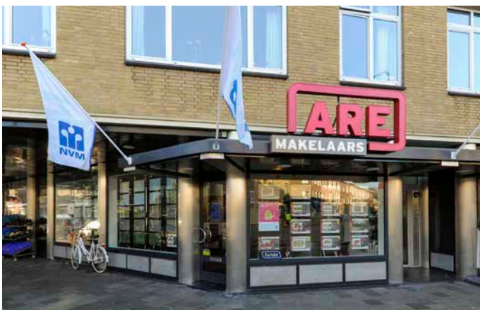
De Eerensplein 8 2593 NA Den Haag