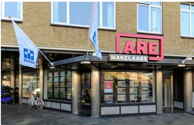
De Eerensplein 8 2593 NA Den Haag