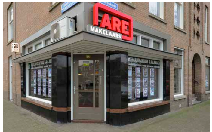
Thomsonlaan 113 2565 JA Den Haag