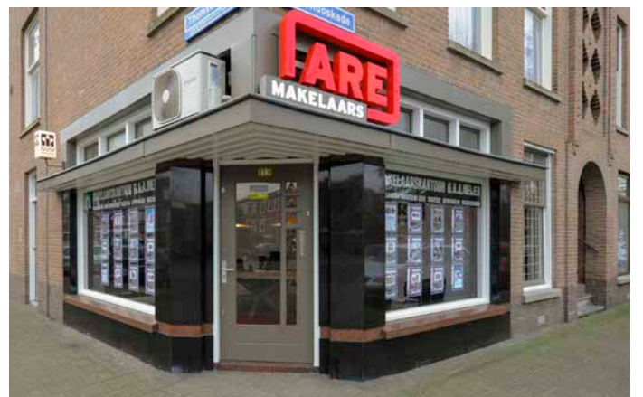
Thomsonlaan 113 2565 JA Den Haag