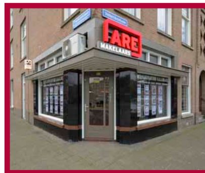
Thomsonlaan 113 2565 JA 's-Gravenhage