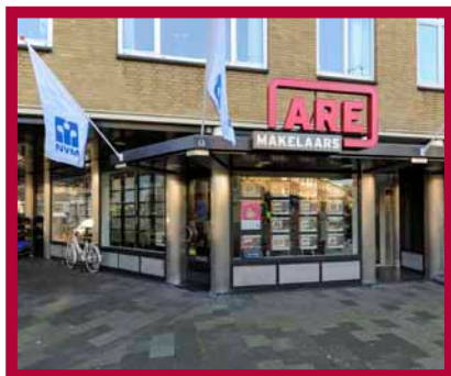
De Eerensplein 8 2593 NA 's-Gravenhage